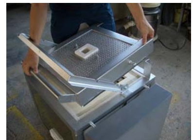
③ 上扉のファイバーは柔らかいのでこすらないように注意して下さい