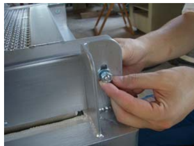
② 上扉の後部から全体を浮かせて、後ろにずらすように取り外します