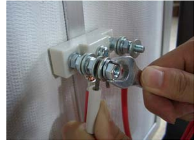
⑮ スパナで固く締めます (碍子に負担をかけすぎて割れないように注意して下さい)