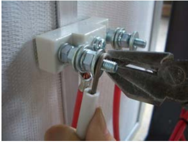
⑬ 元と同じ碍子の端子にヒーター線を巻きつけ