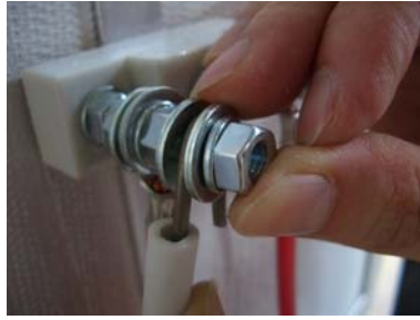
⑭ 取り外した座金とワッシャーでヒーター線を挟んでナットを取り付け