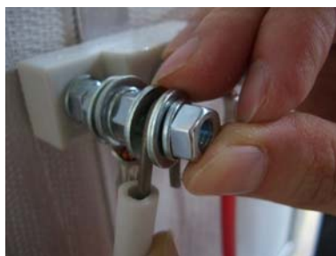
⑭ 取り外した座金とワッシャーでヒーター線を挟んでナットを取り付け