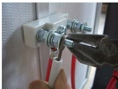
⑬ 元と同じ碍子の端子にヒーター線を巻きつけ