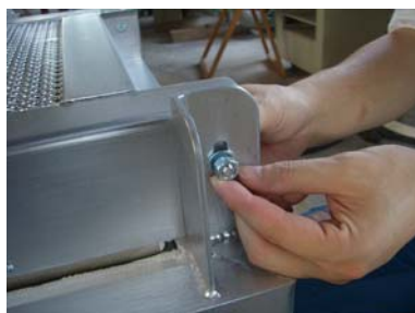
② 上扉の後部から全体を浮かせて、後ろにずらすように取り外します