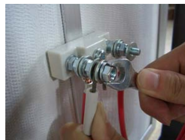
⑮ スパナで固く締めます (碍子に負担をかけすぎて割れないように注意して下さい)