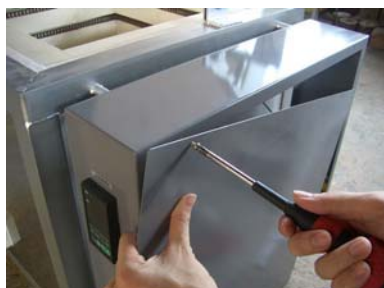
⑯ 配電函のヒーター線がケーブルや端子以外の金属に接していないことを確認し、カバーを取り付けます