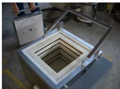
① まず上扉の支点にあるボルト・ナットをはずし